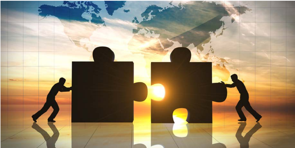
Bảng 1: Danh sách hồ sơ thông báo tập trung kinh tế năm 2016

Năm 2016, Cục Quản lý cạnh tranh đã tiếp nhận và xử lý 04 hồ sơ thông báo tập trung kinh tế, gồm các vụ việc mua lại, sáp nhập trong các lĩnh vực siêu thị bán lẻ, thị trường sữa nước và sữa chua, sản xuất và kinh doanh sản phẩm sử vệ sinh, sản xuất và kinh doanh thuốc thú y, cụ thể: